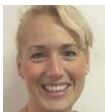
Serena Reins Groep 3